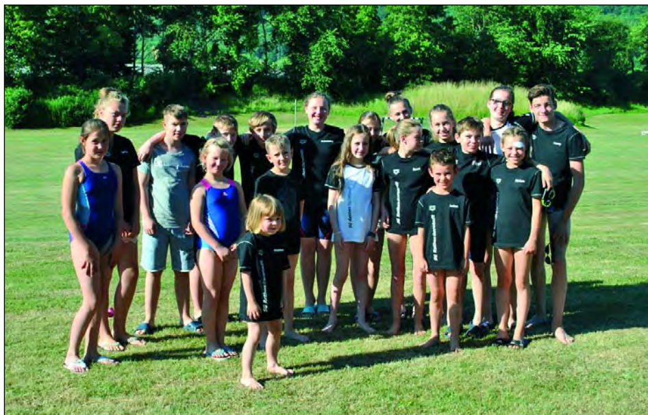
Vergleichsschwimmfest in Springe