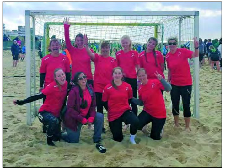
Die Zweite Damen hält unsere Farben hoch

tel- und Halbfinale gingen ohne Punktverlust an die Sarstedterinnen, so dass sie am Sonntag zum Finale auf dem Centercourt auflaufen durften. Eine tolle Kulisse, vor der jede Spielerin vom Stadionsprecher namentlich genannt wurde. Hochmotiviert und durch die einmalige Atmosphäre des Stadions am Strand beflügelt, ließen die „Red Fighters“ ihren Finalgegnerinnen „Beachmix05“ von der HG Bremerhaven keine Chance. Der Jubel hätte nicht größer sein können, als sie sich strahlend nach zwei deutlich gewonnen Halbzeiten als erste Mannschaft unseres Vereins in die Siegerliste des Beachhandball-Turniers in Cuxhaven eintrugen.