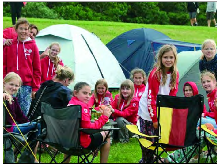
Der Zeltplatz auf dem Deich

bucht werden, welcher in diesem Starterfeld durchaus als respektabel anzusehen war.