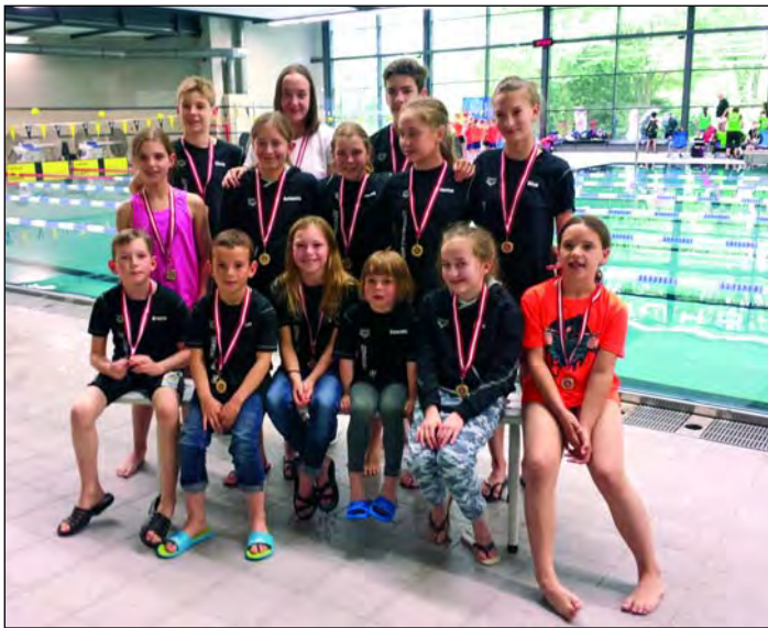
Tolle Platzierungen beim Maikäferschwimmfest in Hamburg