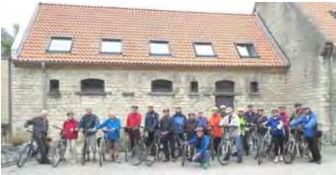
21 Wanderer nahmen diesmal das Rad. Ihr Ziel: das Hofcafé der Domäne Marienburg.

Wenn auch die Gesamtentfernung knapp 40 km betrug: alle sind wohlbehalten und ohne Pannen nach gemütlicher Fahrt wieder