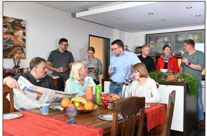
Das Team aus dem Kundencenter Sarstedt freut sich auf Ihren Besuch