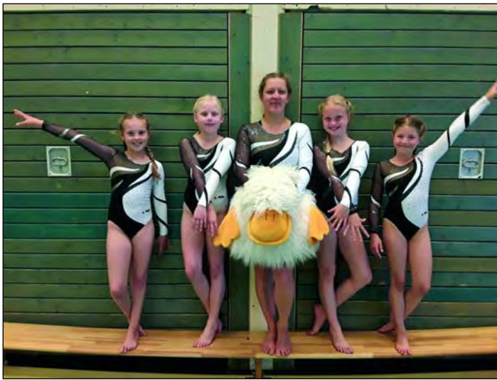
Liga-Hinrunde Bezirksklasse 3