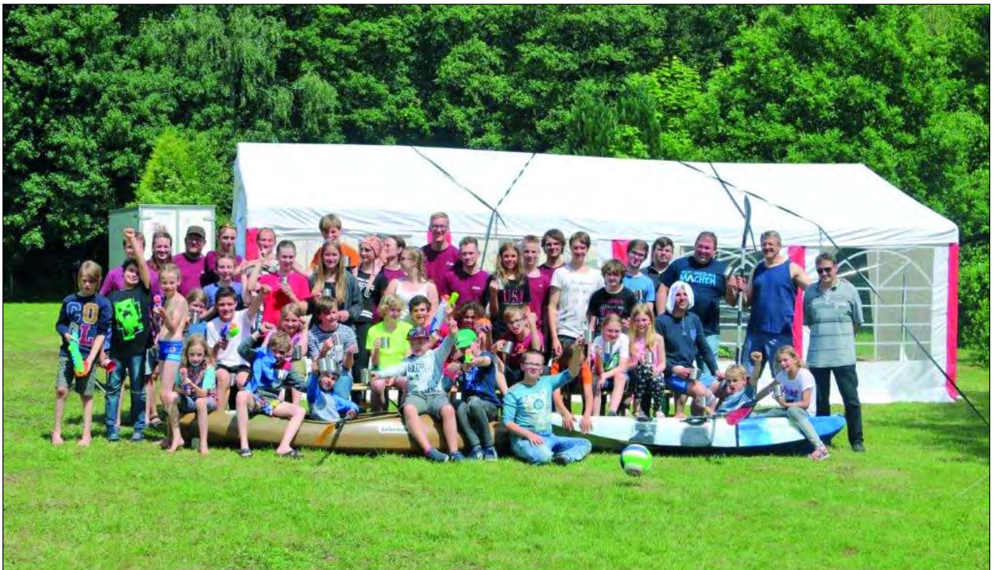
Pfingstfreizeit 2019 am Humboldtsee

nun, genug Wettkampfpunkte zu sammeln, um bereits mit 16 den ersten Dan (Schwarzgurt) machen zu können.