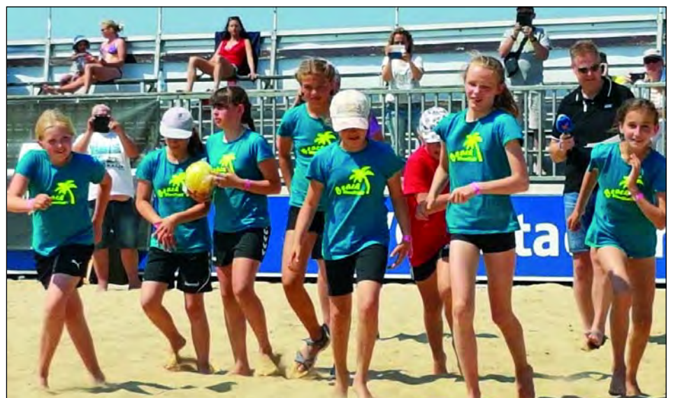
Die weibliche D-Jugend läuft sich im Stadion am Meer warm

Auch für die weibliche C-Jugend sollte nach einer kräftezehrenden Saison der Spaß an erster Stelle stehen, und den hatten die Mädels bereits, als es am Freitag hieß „Zelte aufbauen“. Jeder Mannschaft standen nur wenige Quadratmeter zur Verfügung, aber mit viel Enthusiasmus und Teamgeist wurde diese Hürde problemlos genommen. Die am Abend gemeinsam gestalteten Beachtrikots fanden im Laufe des Turniers auch bei anderen Mannschaften großen Anklang. „Wir haben die Gegner damit verwirrt, weil sie nicht so professionell aussahen. Dadurch hat man uns unterschätzt“, freute sich eine Spielerin. Denn auch dieses Turnier verlief ganz im Sinne des Sarstedter Teams, das als die „Red Fighters“ an den Start ging und diesem Namen alle Ehre machte. Bereits in der Vorrunde wurden alle Spiele mit großem Kampfgeist souverän gewonnen und kein Punkt abgegeben. Und auch Vier-