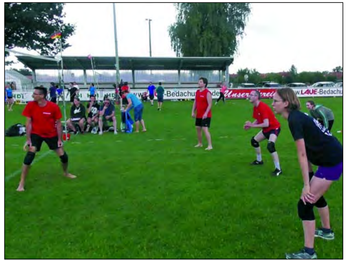
Impressionen vom Freiluft-Volleyballturnier

Der Veranstalter, der TSV Engensen e.V., hat den Wettkampf als Mixed-Turnier ausgelegt, wonach in jeder Mannschaft mindestens zwei Damen spielen mussten. Hier war also der Abteilungsleiter gefragt und musste eine Auswahl treffen. Es wurde bei jedem Spiel gewechselt, so dass jede Spielerin und jeder Spieler zum Einsatz kam.