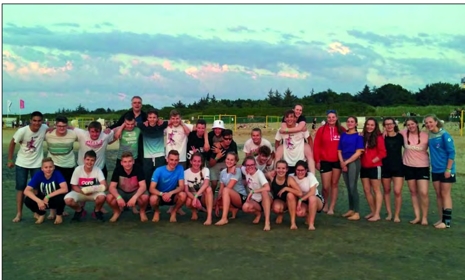
Die weibliche A- und männliche B-Jugend auf dem gemeinsamen Gruppenbild

Den Beginn in Cuxhaven machte die männliche B-Jugend. Gemeinsam mit der weiblichen A-Jugend fuhr man mit dem Zug von Sarstedt nach Cuxhaven. Die Stimmung war von Anfang an sehr gut, obwohl für das Zelten am Deich doch einiges an Gepäck geschleppt werden musste. Man trat unter dem Fantasienamen Red Sox in dem 32 Mannschaften umfassenden Teilnehmerfeld an. In der Vorrunde, die in Gruppenspielen am Samstag ausgetragen wurde, konnten drei von vier Spielen gewonnen werden und damit war die Qualifikation für die Hauptrunde (Platz 1-16) am Sonntag geschafft. Die Stimmung war, trotz des sehr unbeständigen Wetters, sehr gut. Samstagabend wurde entsprechend im Partyzelt am Strand mit Cola und Saft das ausgeschriebene Ziel, das Erreichen der Hauptrunde, gefeiert. Alles weitere sollte das Sahnehäubchen werden, da das Teilnehmerfeld mit etlichen Oberligamannschaften gespickt war. Eine dieser Mannschaften war dann, in der Hauptrunde, die Truppe von Börde Handball. Die erste Halbzeit wurde von den Spielern aus Sarstedt verschlafen und ging deutlich verloren. In der zweiten Halbzeit besann man sich auf seine Stärken und konnte diese durch Golden Goal für sich entscheiden. Somit kam es zum Shootout, welches mit einigem Glück gewonnen wurde und so spielte man um Platz 11. Letztendlich konnte ein überragender 12. Platz ver-