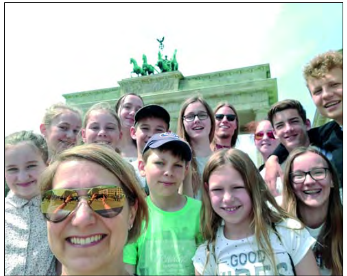
Berlin, Berlin... Internationaler Sportbadpokal

In einem großen Teilnehmerfeld von 61 Schwimmerinnen in ihrem Jahrgang, war sie mit Platz 28 im sehr guten Mittelfeld.