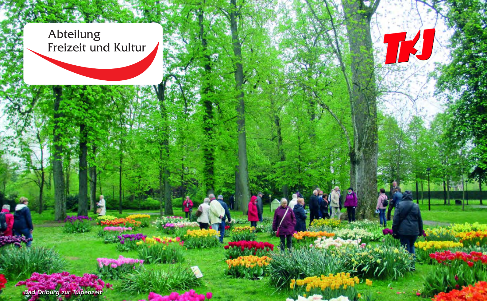
Bad Driburg zur Tulpenzeit