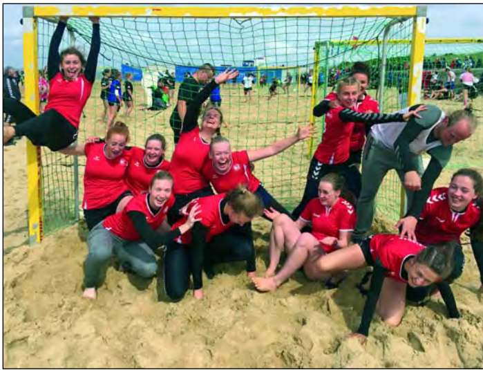
Die Erste Damen kollabiert beim Mannschaftsfoto