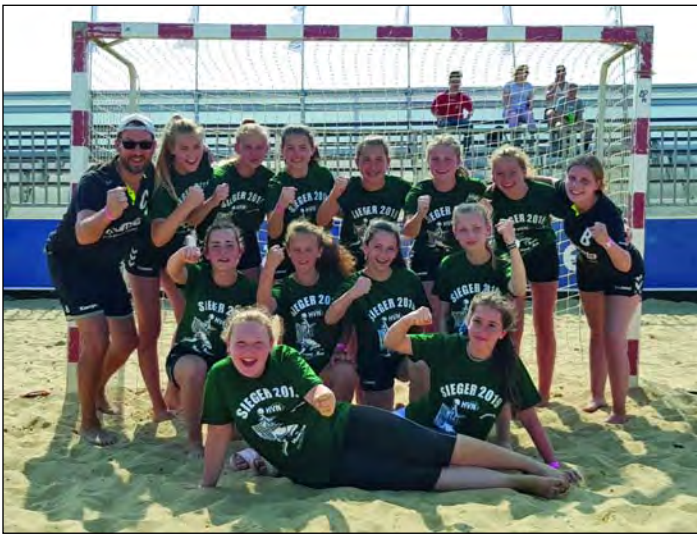
Das erste Siegerbild einer Sarstedter Mannschaft in Cuxhaven – die weibliche C-Jugend