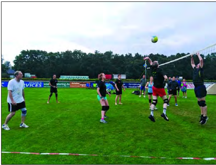
Impressionen vom Freiluft-Volleyballturnier