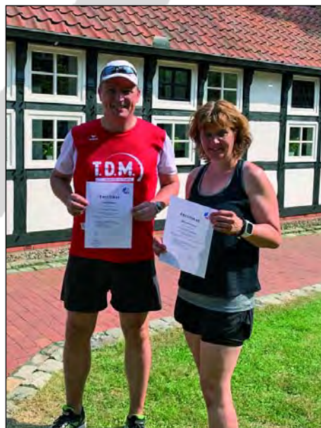
Zertifikat für Lauftreff-Betreuer