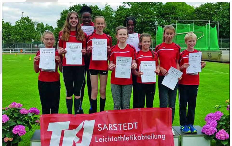
Freude beim U14 Team über ihre Bezirksmeistertitel